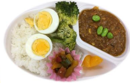
キーマカレー弁当