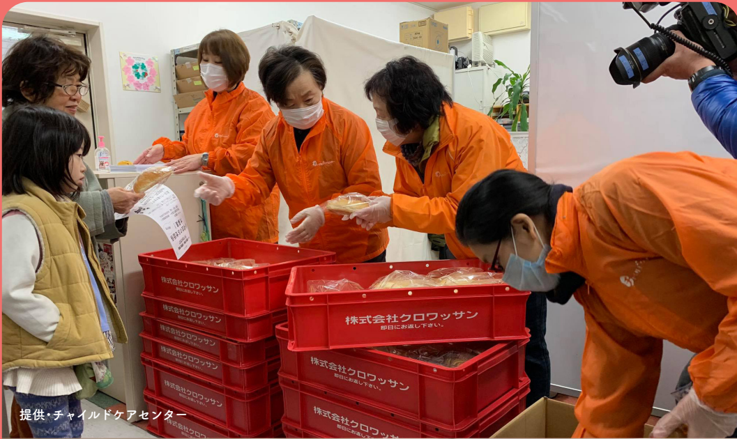
提供・チャイルドケアセンター