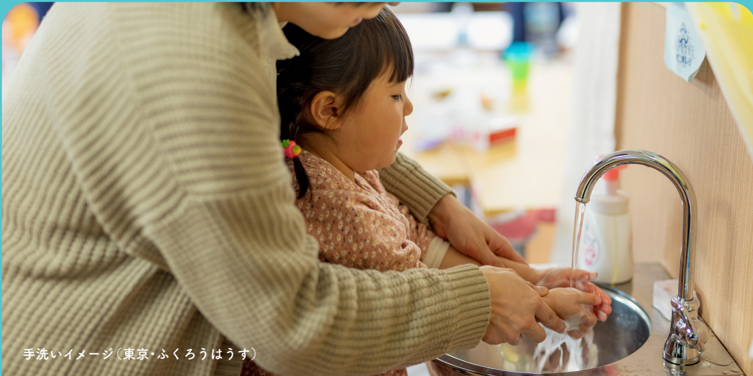
手洗いイメージ(東京・ふくろうはうす)