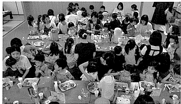
山口県宇部市の子ども食堂は毎回300人以上が集まる

そして、その元となる交流が起こる場のことを居場所という。よって居場所は社会的包摂のため